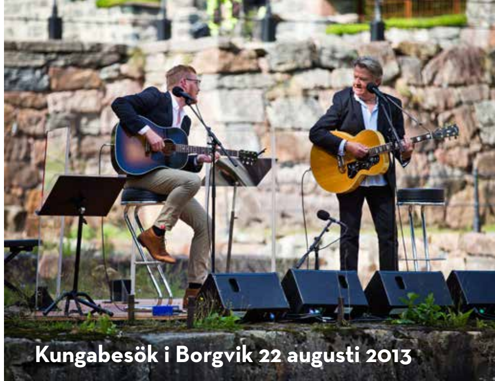
Kungabesök i Borgvik 22 augusti 2013