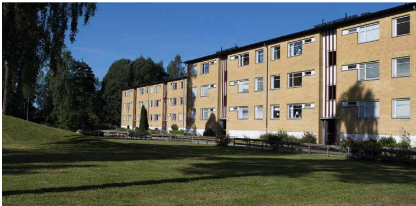
Bostadsområdet Järpegatan i Grums tätort.

I Grums kommun har tillväxtfunktionen det övergripande ansvaret för integrationsarbetet och individ och familjeomsorgen ansvarar för mottagandet av flyktingar. Grums kommun har lång erfarenhet av flyktingmottagning. Sedan 2016 arbetar vi aktivt med integration.