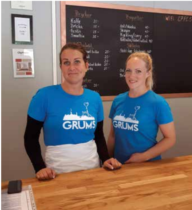
Felizia och Ida jobbar på Svea café.

TEXT: ANNA-MARIA JÄGER