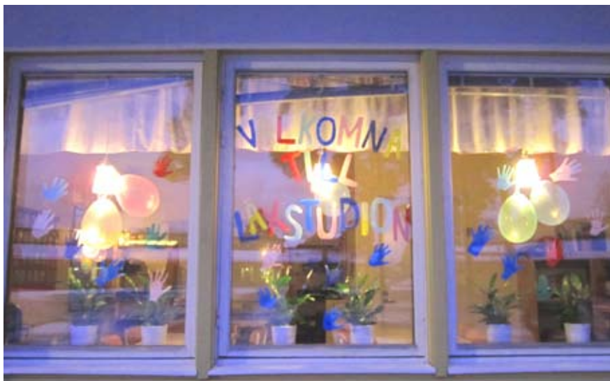
Läsläsning på skolan är populärt.

Inom områden som t. ex lag och ordning, läkarvård och statliga vägar har kommunen varken ansvar eller befogenheter. •