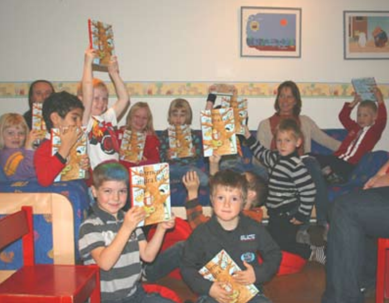
Barnen i förskoleklassen Falken har fått sina böcker.