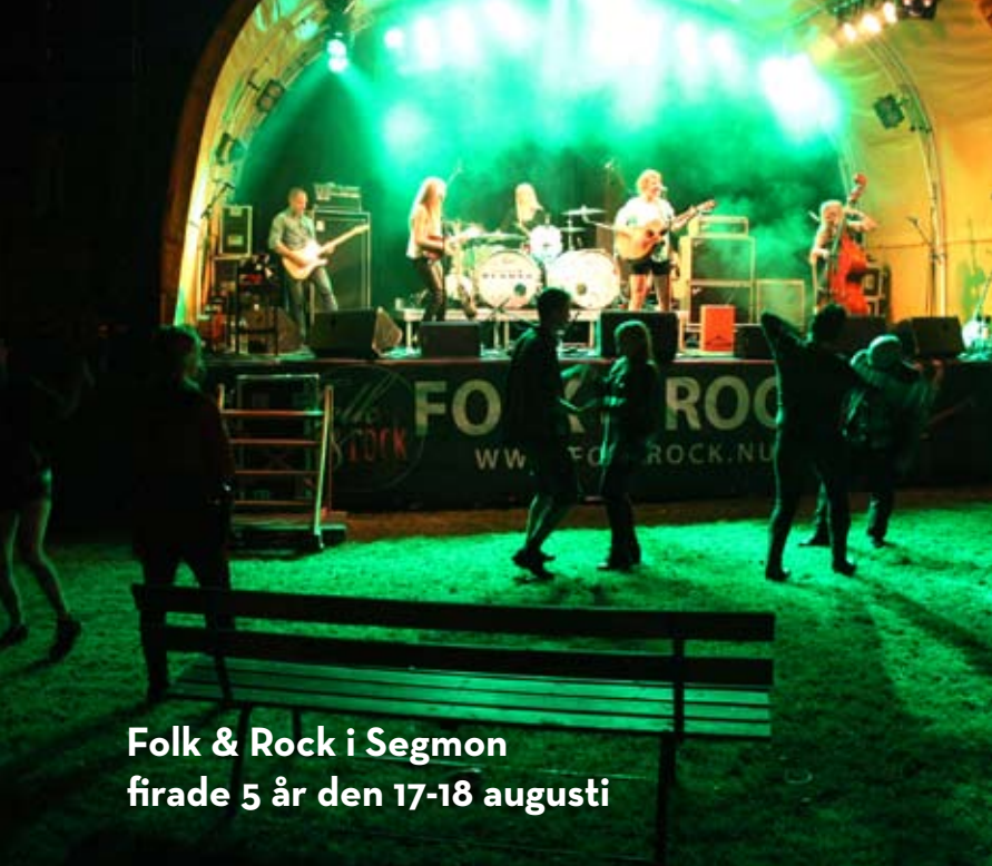
Folk & Rock i Segmon firade 5 år den 17-18 augusti