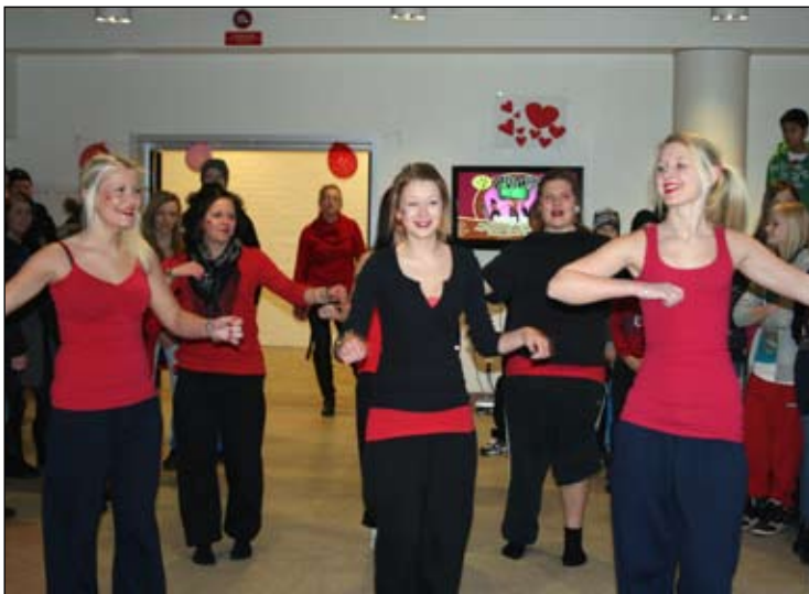
Eleverna dansar Zumba i uppehållsrummet.