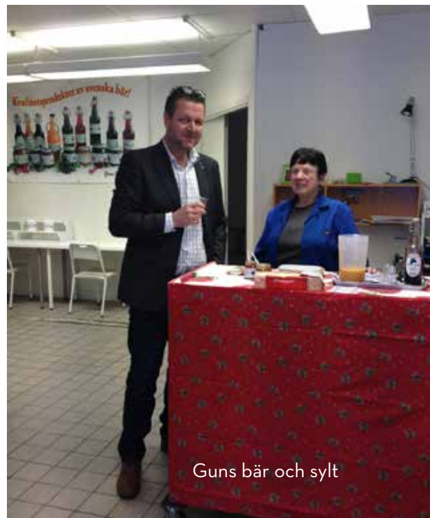
Guns bär och sylt