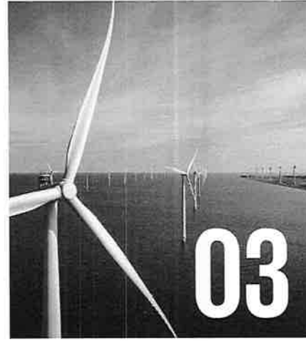
Resultat av granskning